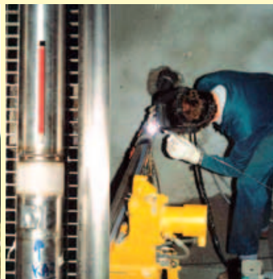
Metingen in de Boomse klei