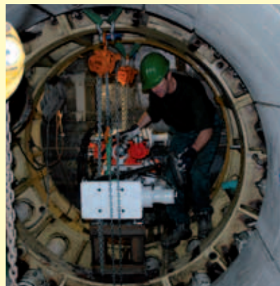
Boring in de Boomse klei