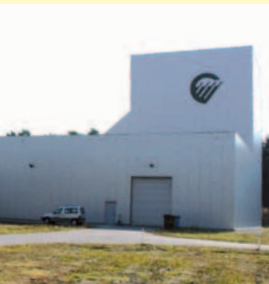
Buitenaanzicht tweede schacht

In HADES wordt geen radioactief afval geborgen en het zal er ook nooit geborgen worden.